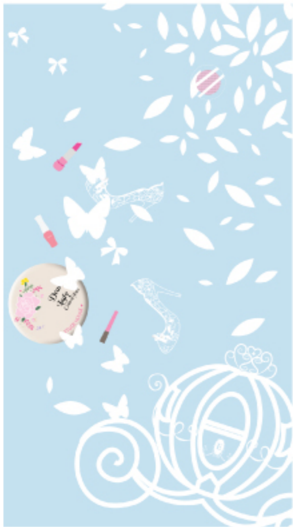
웨딩 일러스트포스터 적용

프린세스가 되는 공간이라는 컨셉을 잡은 에뛰드 매장에 소녀들이라면 한번쯤 꿈꿔보았던 웨딩이라는 컨셉을 잡아 매장에 디스플레이를 해보았다.