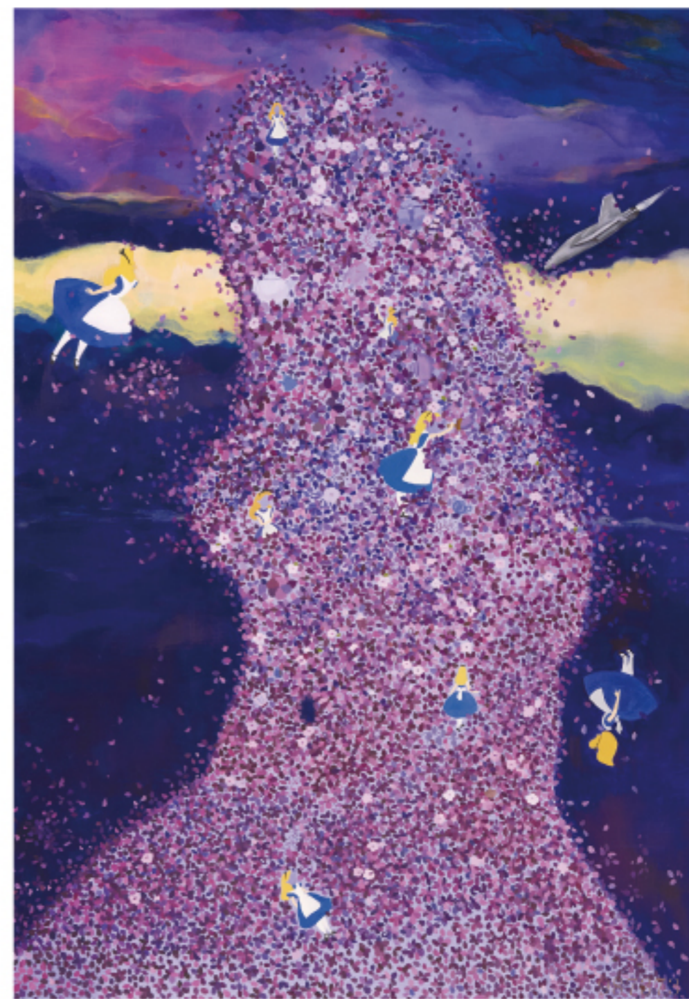
Wonderland #02 Oil on canvas 공모전 입선작