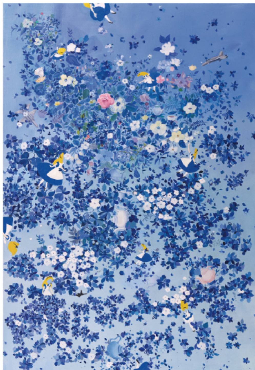
Wonderland #01 Oil on canvas

언젠간 마주해야 하는 현실이지만 아직은 동화 속에 살고 싶은 생각이 큰 나와 앨리스는 닮은 점이 많다. 앨리스와 꽃이 흐드러지는 모습 속에 있는 여러 다양한 오브제들은 내 삶을 즐겁게 해주는 요소들이다. 하지만 언제나 나만의 세계 안에서 살 수는 없는 일이다. 내 앞에서 벌어지는 일에 대해 종종 아무런 힘을 발휘할 수 없거나 낯설고 무서운 현실과 마주해야 할 때가 온다.